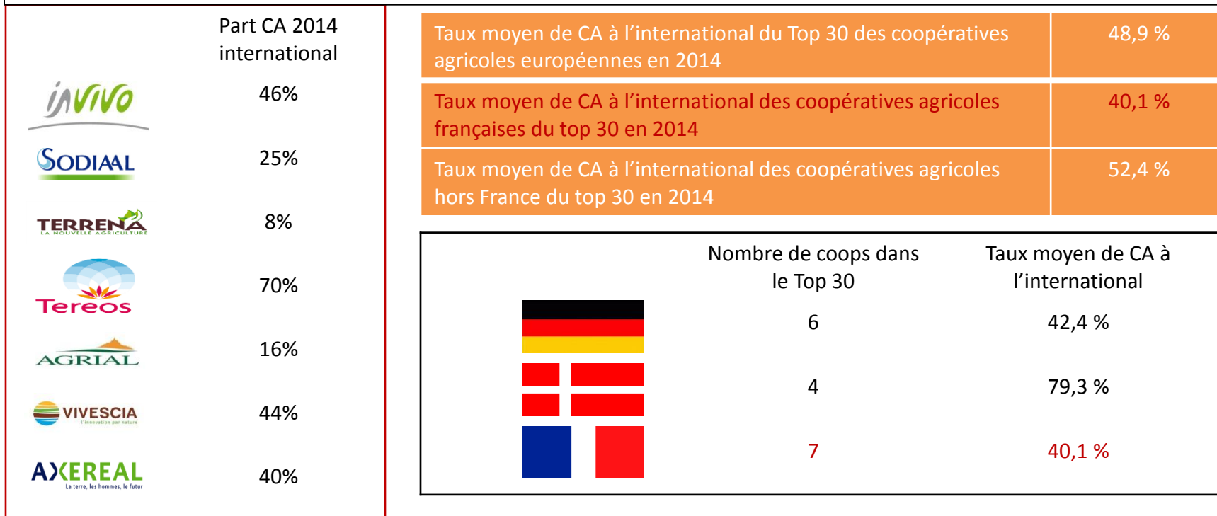
Internationalisation des coopératives agricoles françaises dans le top 30 des coopératives européennes